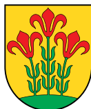
Alytus District Municipality