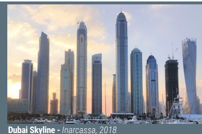
Dubai Skyline - Inarcassa, 2018