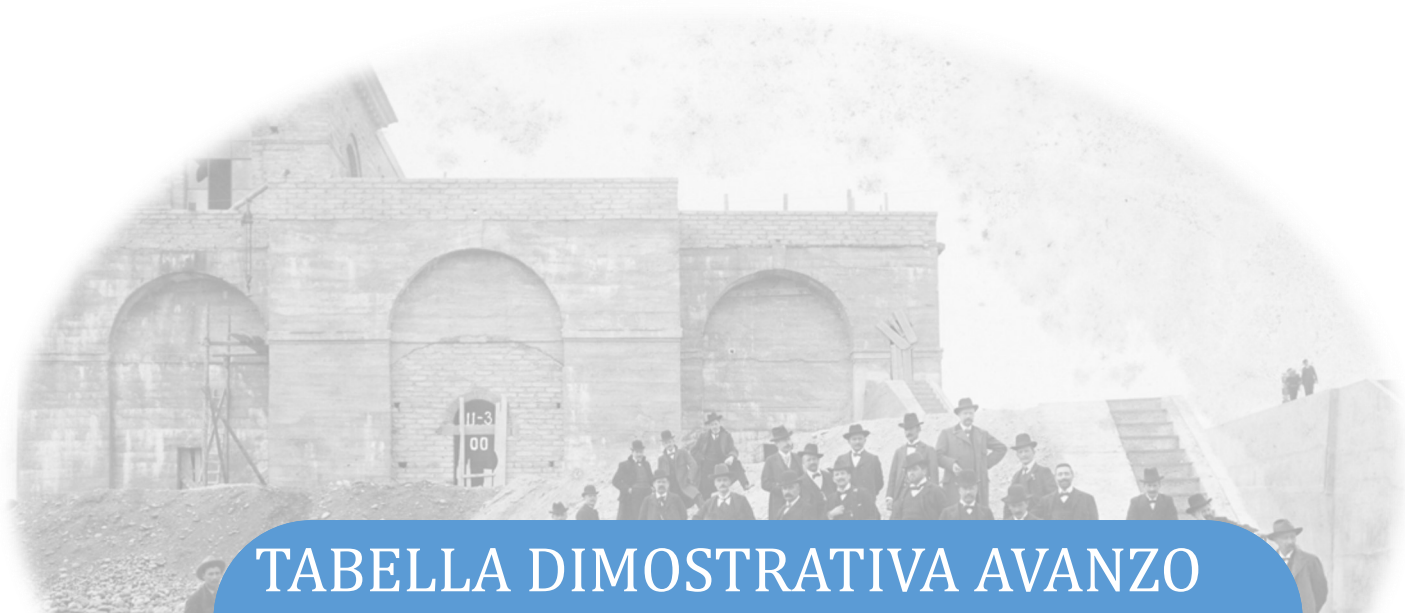
TABELLA DIMOSTRATIVA AVANZO AMMINISTRAZIONE