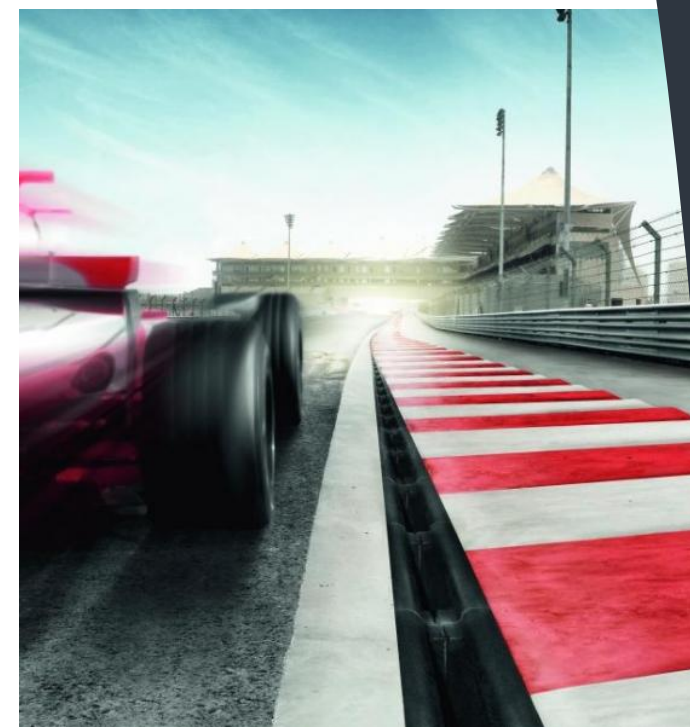
CIRCUITO FORMULA UNO - "YAS MARINA" - ABU DHABI