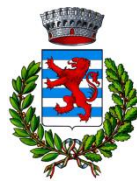
Concordia sulla Secchia