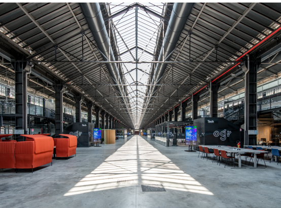
OGR - Officine Grandi Riparazioni, Torino